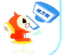
電子申告受付導入済み団体数